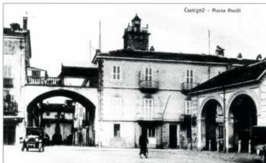
Una vecchia immagine di piazza Pinelli a Cuornè

C'era una volta una famiglia originaria di Inghia, abitante a Cuornè, che ad un certo momento decise di cambiare il cognome, nella convinzione di discendere da uno dei partecipanti alla congiura dei Fieschi, avvenuta a Genova, il 2 gennaio 1547.